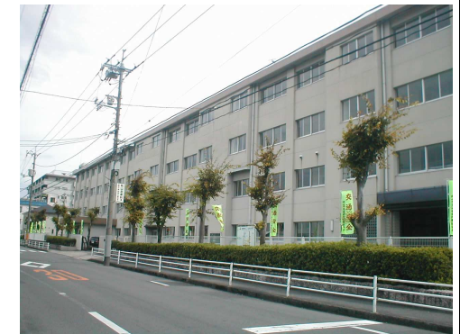
三門小学校 徒歩11分