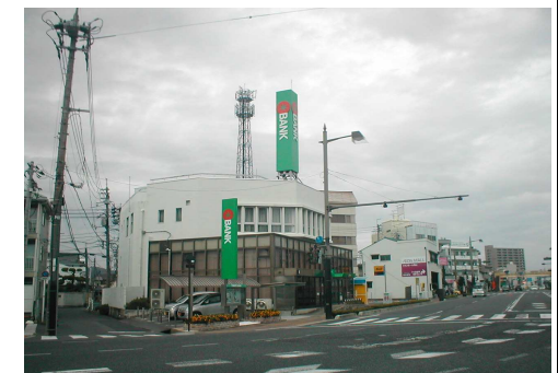
トマト銀行 徒歩2分